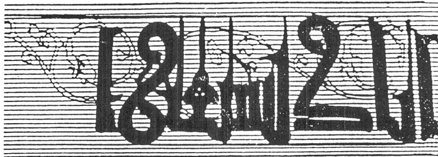
یزد - مسجد شاه ابوالقاسم - کتیبه نگاری محراب - (ایاک نستین)

بر روی هلال طاق نما که قسمت پایه اکثر حروف، لایه‌ای از گچ حاک کشیده شده و تخریب گردیده است، و از حرکت برخی حروف به نظر می‌رسد که سوره "اخلاص" کتابت شده باشد. و آنچه از این قسمت دیده می‌شود، بخش فوقانی حروف و کلمات