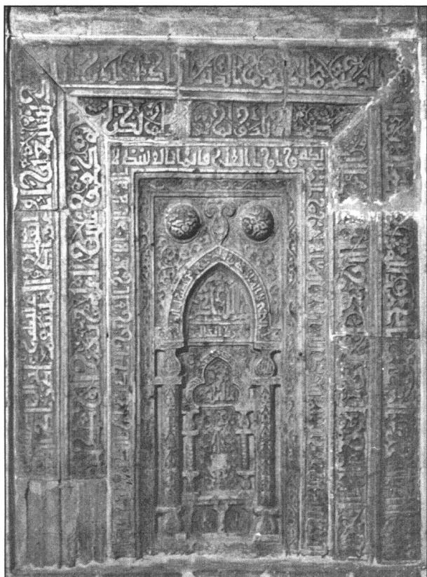
سنگ محراب مسجد فرط - قرن ششم هجری.