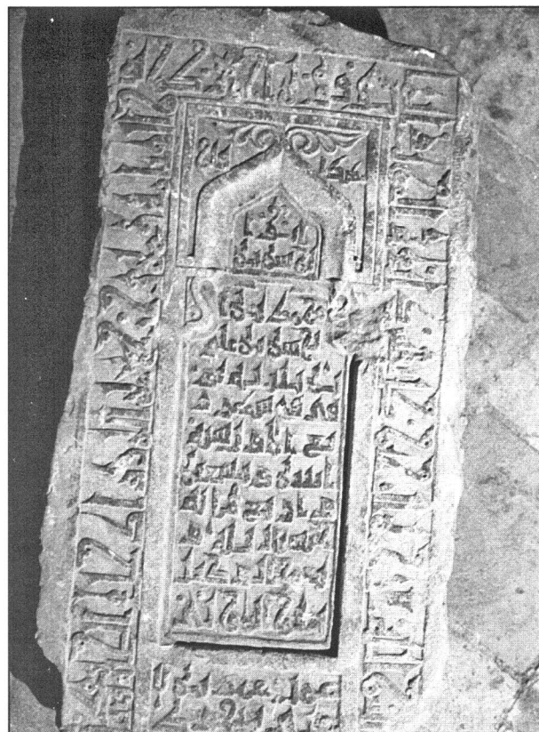
سنگ قبر مسجد جامع یزد - (۴۹۲ ق. هـ)